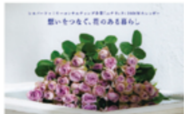
▲2026年ニチリョクカレンダー