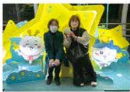
社内でも有数の「ちいツタ」です。休みの日や仕事帰りは「ちい活」をしています。

私自身もそうですが、「終活」と聞くと身構えてしまう面があります。お客様相談室が今以上にニチリヨクとお客様の距離を縮める存在となり、日常生活の中に「終活」が溶け込むきっかけを作っていきたいと考えています。