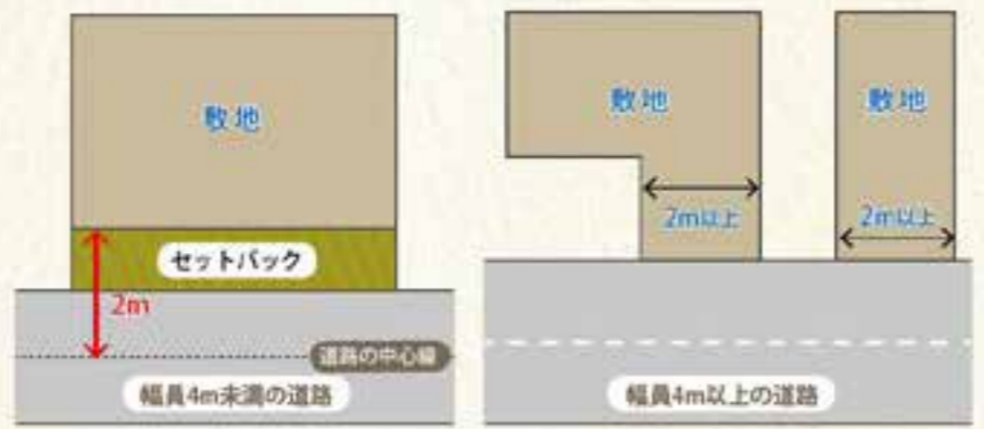
敷地の形状に関わらず、4m以上の道路に2m以上接していれば接道義務は満たされます。道路が4m未満の場合、左図のように敷地の境界を道路の中心線から2m後退させます。

お墓に関するあらゆるご質問・ご相談を募集いたします。お墓書を左記までお送りください。 T103-0028 中央区八重洲1-7-20、8階 株式会社ニチリョク倶楽部事務局 どうする!? 我が家のお墓係