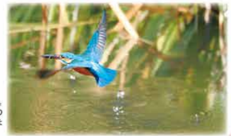
カワセミを漢字で書くと「翡翠」。宝石の翡翠（ひすい）は、この鳥の羽色から名づけられました。