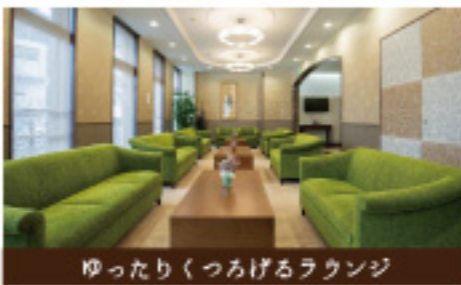
ゆったりくつろげるラウンジ