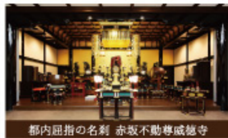
都内屈指の名刹 赤坂不動尊威徳寺