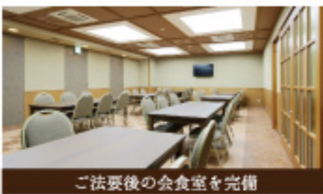
ご法要後の会食室を完備