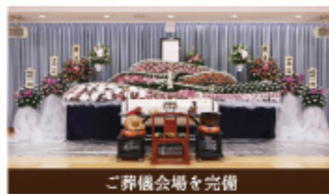
ご葬儀会場を完備