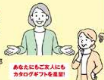
あなたにもご友人にもカタログギフトを進呈！

ご葬儀やお墓についてお考えのご友人がいっぱいありましたら、ぜひさくら倶楽部をご紹介ください。ご紹介いただいた方が、さくら倶楽部に入会されますと、会員様と入会されたお客様双方にカタログギフト 3000円相当を進呈いたします。