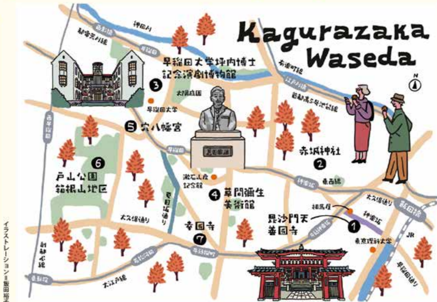
イラストレーション：飯田裕子