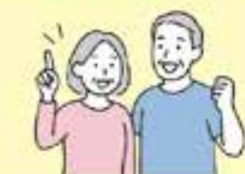
今なら2万円引きでさくら倶楽部の優待特典をゲット！

あおい倶楽部会員がこの期間中にさくら倶楽部に入会しますと、入会金を通常3万円のところ1万円に割引いたします。