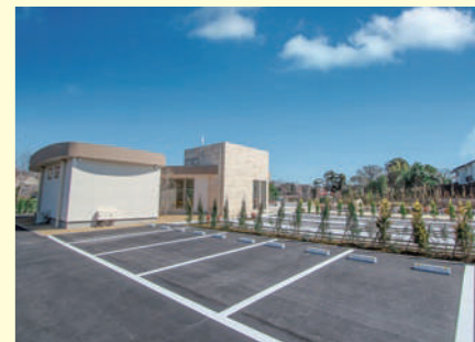
【車で墓域近くまで】