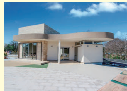
【近代的でモダンな休憩室】