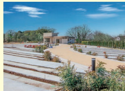
【バリアフリーの参道】