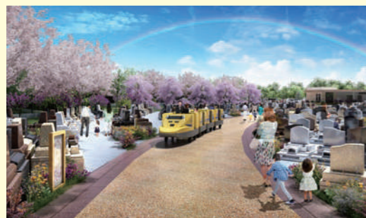
【搭乗可能なドクターイエロー】(土日祝のみ)