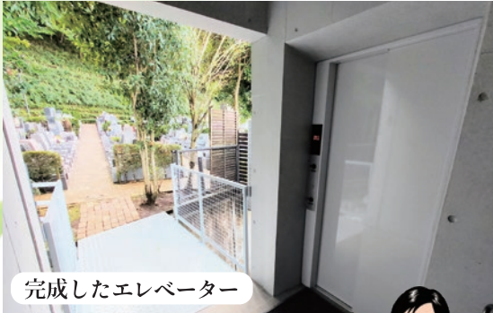
完成したエレベーター